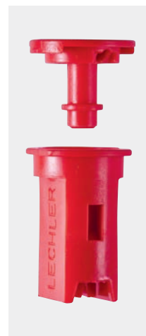
Tööriistadetta väljavõetav injektor